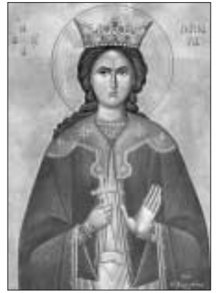
Η ΑΓΙΑ ΒΑΡΒΑΡΑ “ΣΩΖΟΙ ΤΟ ΠΥΡΟΒΟΛΙΚΟΝ”

ΤΡΙΜΗΝΙΑΙΑ ΕΦΗΜΕΡΙΔΑ ΤΟΥ ΣΥΝΔΕΣΜΟΥ ΑΠΟΣΤΡΑΤΩΝ ΑΞΙΩΜΑΤΙΚΩΝ ΠΥΡΟΒΟΛΙΚΟΥ ΤΟΥ ΕΛΛΗΝΙΚΟΥ ΣΤΡΑΤΟΥ