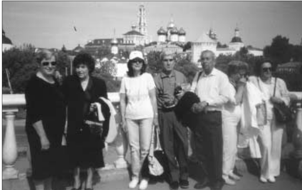
Μπροστά στο τριαδικό Μοναστήρι Αγίου Σεργίου - Αγίας Τριάδος (Λαύρα).

Η πρόσφατη Σύνοδος των οκτώ πλουσιότερων χωρών στην Αγία Πετρούπολη