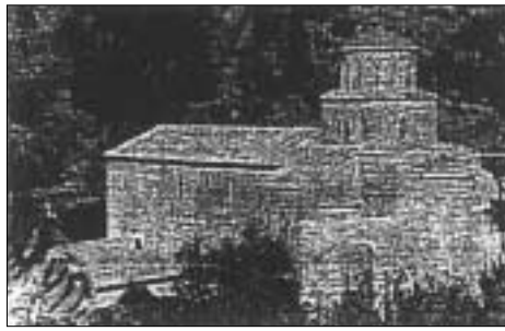
Ι. Μ. Οσίου Ιωάννου Θεριστού.