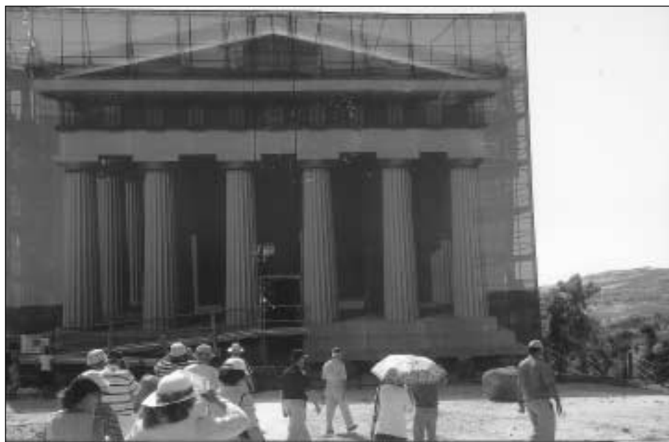
Ο Ναός της Ήρας, από την Κοιλιάδα των ναών του ΑΚΡΑΓΑΝΤΑ.