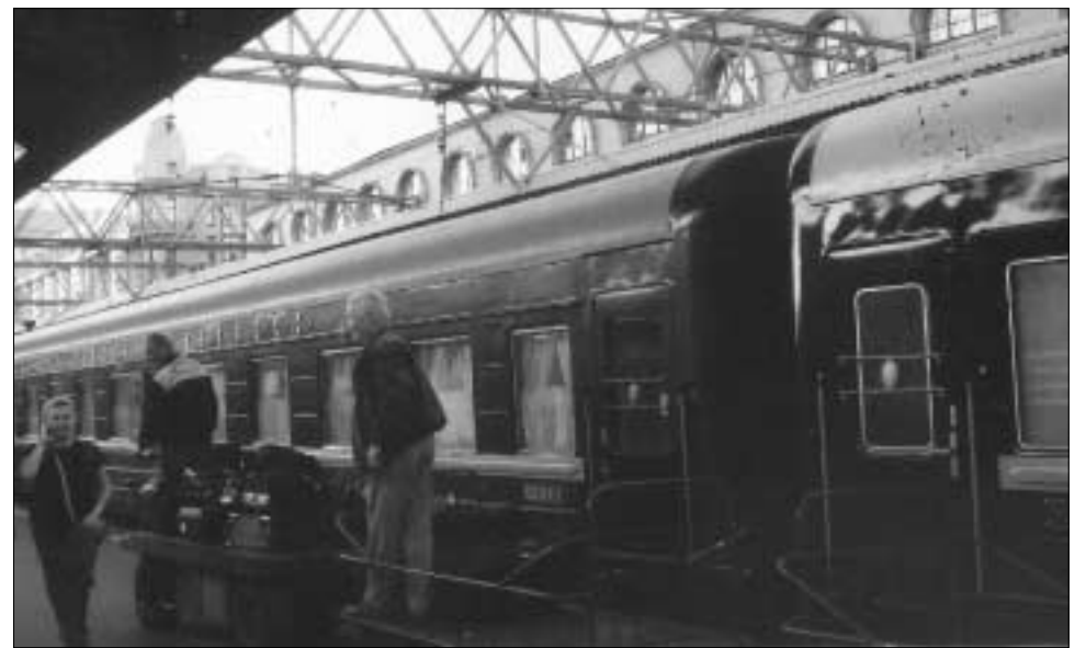
Στο σιδηροδρομικό σταθμό Αγίας Πετρούπολης. Επιβίβαση στο τρένο.

Έπειτα από 13 χρόνια διαπραγματεύσεων, μια αποφασιστική συμφωνία μεταξύ Ουάσιγκτον και Ρωσίας παραμένει δύσκολη γι' αυτό και η σύνοδος των G8 περιορίστηκε στις φιλοδοξίες και στον ανταγωνισμό των δύο δυνάμεων, της Ρωσίας και της Κίνας.