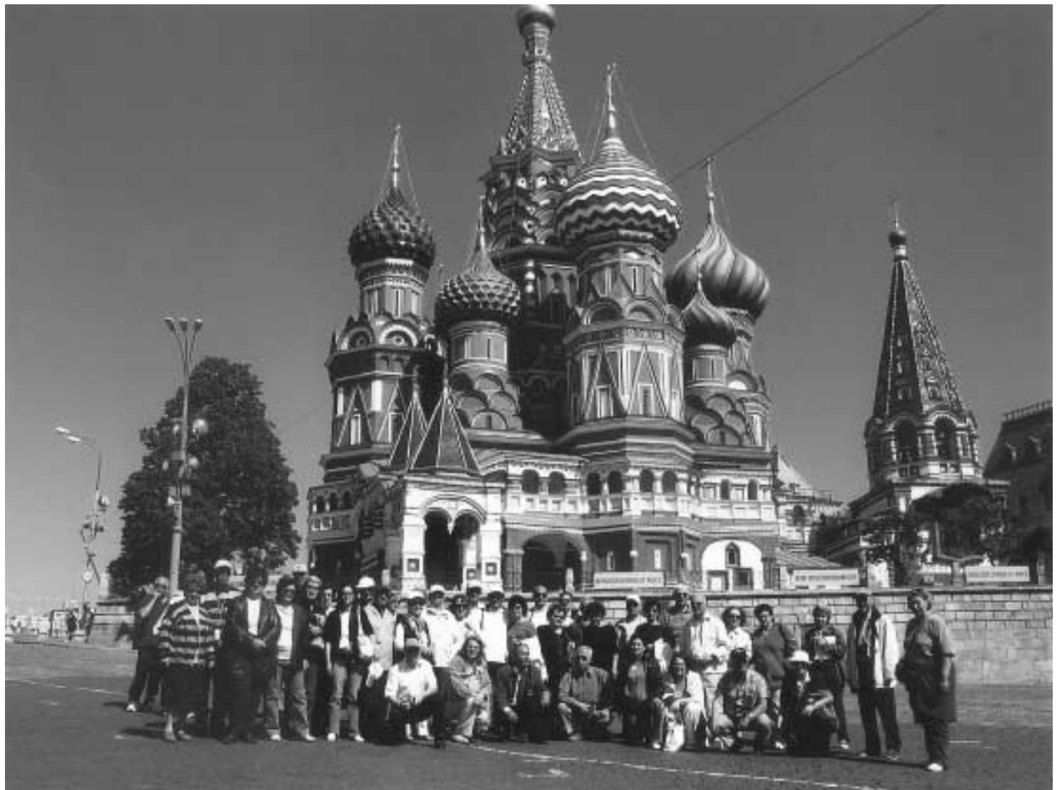
Μπροστά στον Καθεδρικό Ναό του Αγίου Βασιλείου πλησίον του Κρεμλίνου στην Κόκκινη Πλατεία.

Η Μόσχα, αν και ξεκίνησε ως άσημο αγκυρικό οχυρό, έφθασε να κυβερνά το ένα