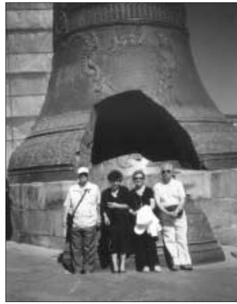
Η μεγαλύτερη καμπάνια στον κόσμο, με το κομμάτι των 11 τόνων, που αποκόπηκε.

Το Κρεμλίνο διεκδικεί την ισότιμη παρουσία του στην παρέα των πλουσίων αυτού του κόσμου, μια θέση που την κέρδισε, αν όχι με το σπαθί του, τουλάχιστον χάρη στα μεγέθη της απέραντης και τόσο πλούσιας σε φυσικό πλούτο χώρας. Χωρίς αμφιβολία, το μεγάλο όπλο της Ρωσίας είναι αυτή τη στιγμή η Ενέργεια, ό-