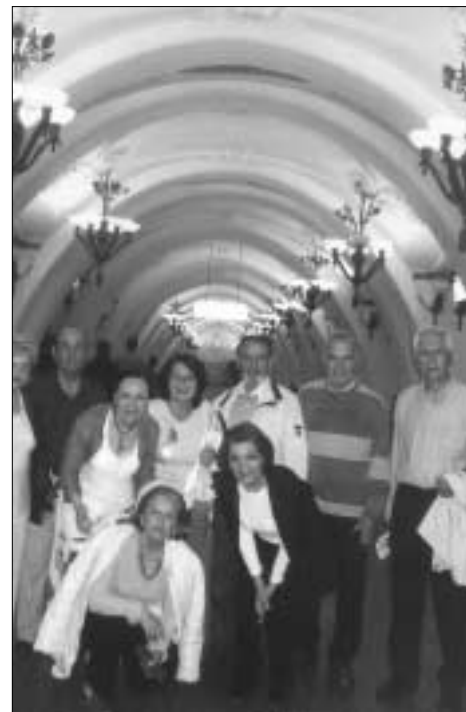
Στο εκπληκτικό θολωτό εσωτερικό του σταθμού Αρμπάτσαγια του Μειρό.

ροδρομικές γραμμές φθάνουν τα 250 χιλιόμετρα. Καθημερινά κινούνται πάνω από 7.800 τρένα με ταχύτητα 90 κλμ/ώρα και μεταφέρουν 6-8 εκατομμύρια επιβάτες, ε-