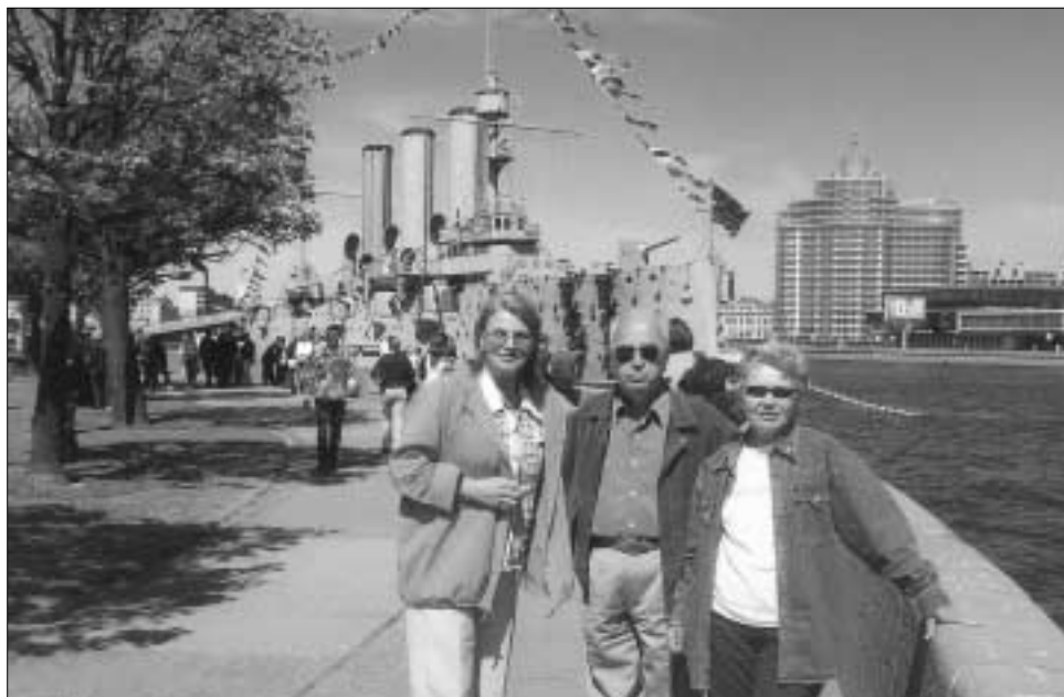
Αγία Πετρούπολη: Πολεμικό πλοίο «Αιόρα», απ' όπου κανονιοβόλησαν το Χειμερινό Ανάκτορο τη νύχτα της 25ης Οκτωβρίου 1917.

Καθημερινά, χιλιάδες τουριστών από όλο τον κόσμο περιμένουν στην ουρά για