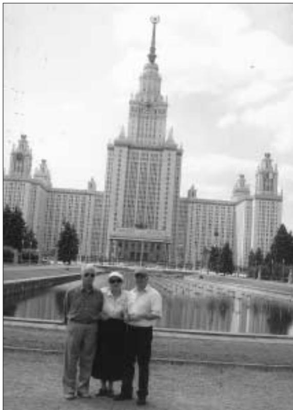
Μόσχα: Κρατικό Πανεπιστήμιο στον σταλινο-γοτθικό ουρανοξύστη.

Το 1340 ο Σέργιος του Ραντονέζ, που ήταν τέκνο οικογένειας ευγενών, έκτισε μια μικρή εκκλησία στα δάση βόρεια της Μόσχας και την αφιέρωσε στην Αγία Τριάδα. Πολύ σύντομα οργάνωσε σε κοινότητα όλους τους προσκυνητές που έσπευσαν εκεί και καθώς αποκτούσε πλούτο και επιρροή το Μοναστήρι επε-