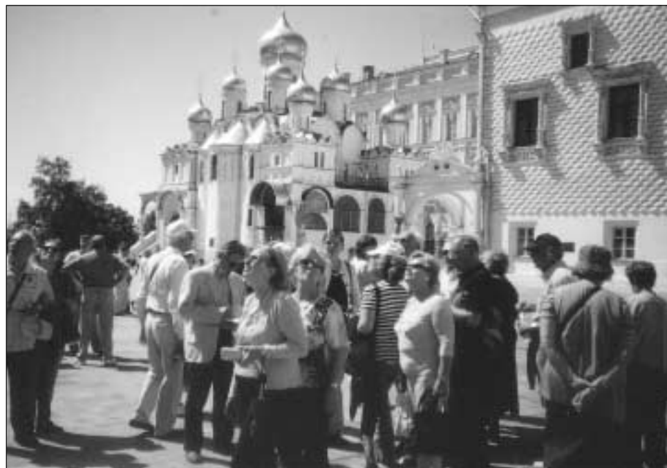
Κρεμλίνο. Μπροστά στον Καθεδρικό Ναό της Κοιμίσσεως.

Η πόλη άρχισε να χτίζεται το Μάιο του 1703 από τον Μέγα Πέτρο, ο οποίος ήθελε να την καταστήσει «παράθυρο» της Ρωσίας στην Ευρώπη. Για την κατασκευή της επιστρατεύθηκαν αρχιτέκτονες από όλη την Ευρώπη, ενώ σταμάτησε κάθε οικοδομική δραστηριότητα στην ευρύτερη περιοχή προκειμένου όλοι οι εργάτες να συνεισφέρουν στο έργο της ανοικοδόμησης της νέας πόλης. Κατά το 18ο και το 19ο αιώνα η ελίτ της Ρωσίας επιδόθηκε στην κατασκευή μεγαλοπρεπών κτιρίων και παλατιών, μετέχοντας στη κληδιά και στην πολυτέλεια της «έδρας» του τσαρικού καθεστώτος, το οποίο ωστόσο ανέτρεψαν τον Οκτώβριο του 1917 ο Λένιν και οι Μπολσεβίκοι. Ο θάνατος του Λένιν είχε ως αποτέλεσμα, η πόλη να μετονομαστεί σε Λένινγκραντ -ως φόρος τιμής στον εκλιπόντα ηγέτη-, εξέλιξη που κατά τη διάρκεια του Β' Παγκοσμίου Πολέμου θα την καθιστούσε πρωταρχικό στόχο -προπαγανδιστικό σημειολογικό- των ναζι. Για 29 μήνες το Λένινγκραντ έζησε μια άνευ προηγουμέ-