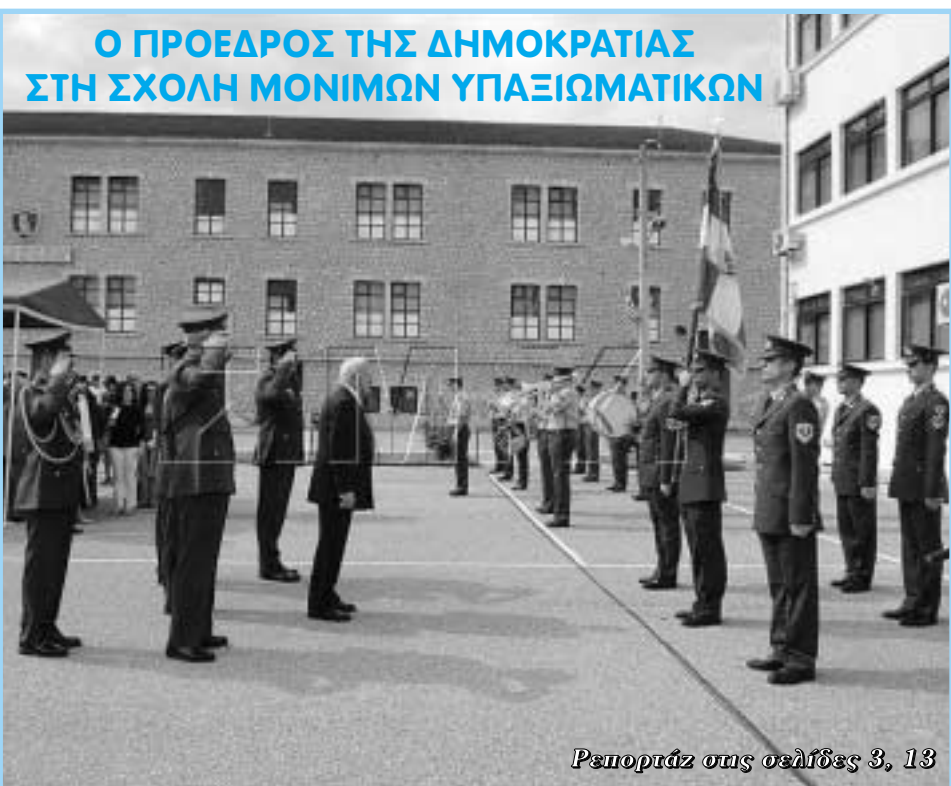
Ο ΠΡΟΕΔΡΟΣ ΤΗΣ ΔΗΜΟΚΡΑΤΙΑΣ ΣΤΗ ΣΧΟΛΗ ΜΟΝΙΜΩΝ ΥΠΑΞΙΩΜΑΤΙΚΩΝ