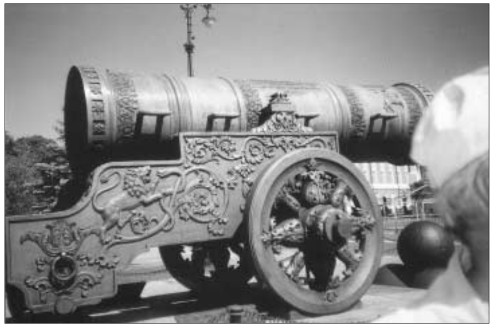
Το κανόνι του Τσάρου στο Κρεμλίνο.

νου πολιορκία από σειρά βομβαρδισμών, που, πέρα από την καταστροφή σημαντικών μνημείων, κόστισαν τη ζωή σε περίπου 500.000 ανθρώπους. Το Λένινγκραντ δεν έπεσε -ο Στάλιν κέρδισε στη μάχη της προπαγάνδας- και έγινε η πρώτη ρωσική πόλη