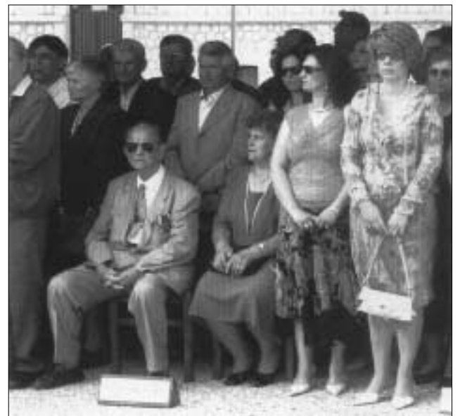
Ο κ. Γαγάρας (με τα παράσημα) παρακολουθεί την τελετή.

Ιδιαίτερα ευνοϊκά σχολιάστηκε η για πρώτη φορά παρουσία του Προέδρου της Δημοκρατίας στη σχολή, από το 1975 που άρχισε να λειτουργεί στην πόλη των Τρικάλων.