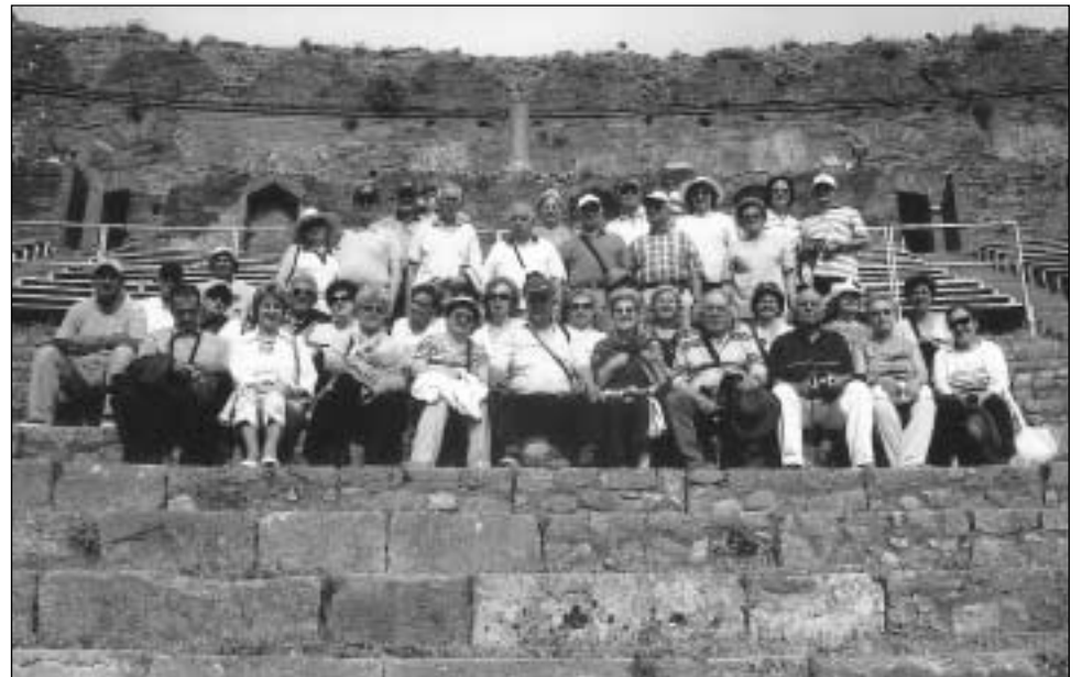
Οι εκδρομείς στο ΤΑΟΥΡΜΙΝΙΟ Αρχαίο Ελληνικό Θέατρο «GRECO THEATRO», όπως γράφει η πινακίδα έξω από το θέατρο.

ανέπτυξαν ένα πολιτισμό, εν πολλοίς υψηλότερο από τις Μητροπόλεις των αποικιών, όταν θαυμάζει κανείς και σήμερα τις αρχαιότητες αυτές των προγόνων μας, όταν επισκέπτεται τις Συρακούσες και το Ταορμίνιο και βλέπει τα μεγαλοπρεπή θέατρα να έχουν έξω την επιγρα-