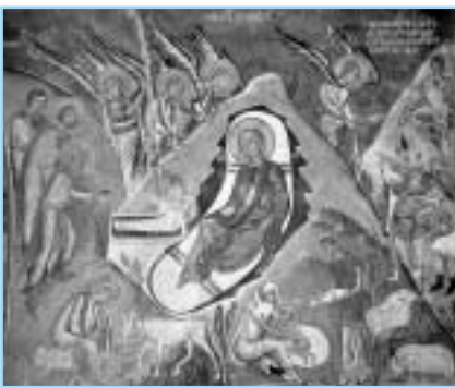
Της Πόπης Κουβέλη, Συμβολαιογράφου

Έτσι αρχικά στη Ρώμη, όπως αποδεικνύουν ιστορικές πηγές, πιθανότατα το 335/6 μ.Χ. (σίγουρα πάντως το 354 μ.Χ.) καθιερώθηκε ο εορτασμός της Θείας Γέννησης αυτοτελώς στις 25 Δεκεμβρίου μετά από πολλές συζητήσεις και τού-