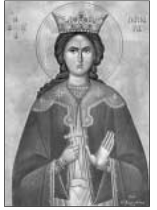
Η ΑΓΙΑ ΒΑΡΒΑΡΑ “ΣΩΣΤΙ ΤΟ ΠΥΡΟΒΟΛΙΚΟΝ”

ΤΡΙΜΗΝΙΑΙΑ ΕΦΗΜΕΡΙΔΑ ΤΟΥ ΣΥΝΔΕΣΜΟΥ ΑΠΟΣΤΡΑΤΩΝ ΛΕΙΩΜΑΤΙΚΩΝ ΠΥΡΟΒΟΛΙΚΟΥ ΤΟΥ ΕΛΛΗΝΙΚΟΥ ΣΤΡΑΤΟΥ