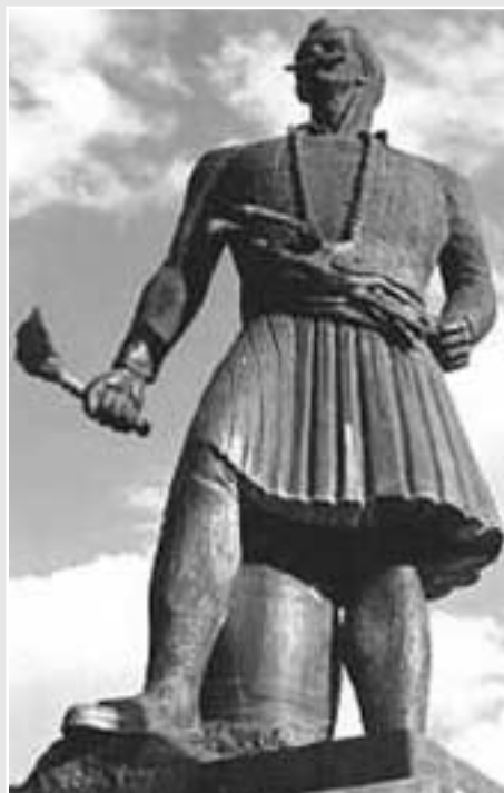
Η προτομή του Γεωργιάκη Ολύμπου.

Το 1804 οι Σέρβοι επαναστάτησαν κατά των Τούρκων υπό την ηγεσία του Γεωργίου Πέτροβιτς, του ενονομαζόμενου Καραγεώργεβιτς ή Καραγεώργη, αλλά η επανάσταση αυτή, που κράτησε περίπου οκτώ χρόνια, δεν είχε αίσιο τέλος, διότι η Ρωσία τους εγκατέλειψε και σύναψε ειρήνη με το σουλτάνο (Συνθήκη του Βουκουρεστίου 16/28 Μαΐου 1812).